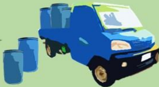
乙級 一般事業廢棄物 (廠商載走清運)