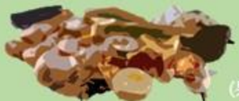
製備餐食過程中 所產生的 生廚餘 (果皮、未經烹煮的各式蔬菜殘渣等)