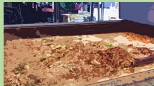
環保署 廚餘再利用檢覈許可業者 (畜牧場)