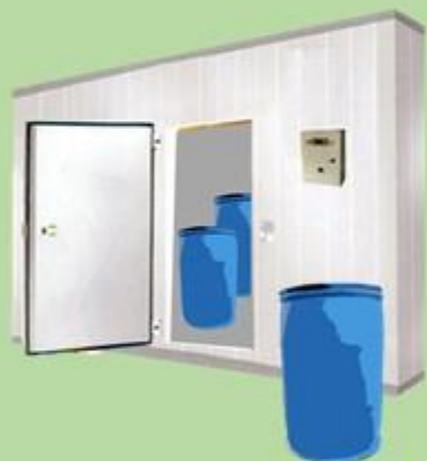
中心餐廳-廚餘間 (廚餘間，冷藏7°C以下)