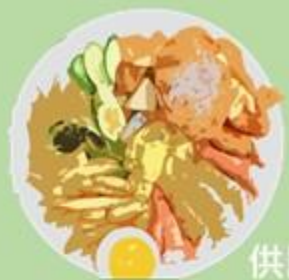
供膳區的 熟廚餘 (未食用完的菜餚&吃不完的廚餘)